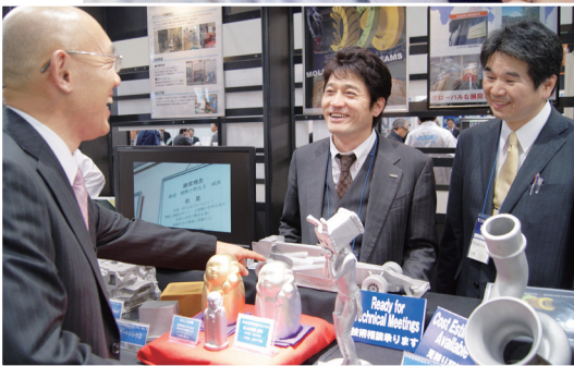
展示会に出展(東京ビッグサイト)