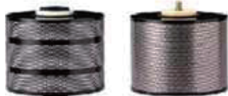
自社オリジナルのフィルター

“Filter3R”事業(Recycle:再資源化、Reuse:再利用、Reduce:削減)は、使用済みのフィルターを回収し、同社のクリーニング工場で独自の洗浄技術によりフィルタークリーニングを行う。ユーザーはクリーニング済みのフィルターを再度使用することができる。また、フィルターに付着するスラッジの再資源化にも成功している。スラッジは人工骨材となり、産業廃棄物の削減に大きく貢献している。