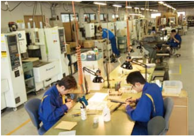
熟練工による手作業も抜群の精度を誇る。

同社は現在、経営革新の真っただ中にある。昨年7月に第二工場を開設。今年1月にISO14001の認証を取得した。5月にはISO9001の認証を取