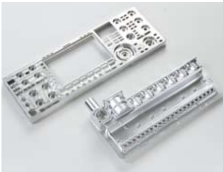
アルミの切削加工品(大物)。

昨年7月に立ち上げた第二工場は20人という少数精鋭でスタート。新しい加工方法や人材の育成に力を入れている。