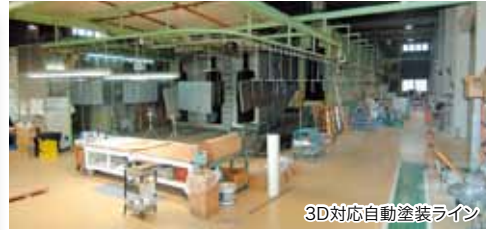
3D対応自動塗装ライン

日本、海外問わず、「インターネット」「3Dと職人の融合」をキーワードに自社工場の展開と業務連携を拡大し、UMF (United of Metal Fabricators) グループで全国シェアの1%を獲得!